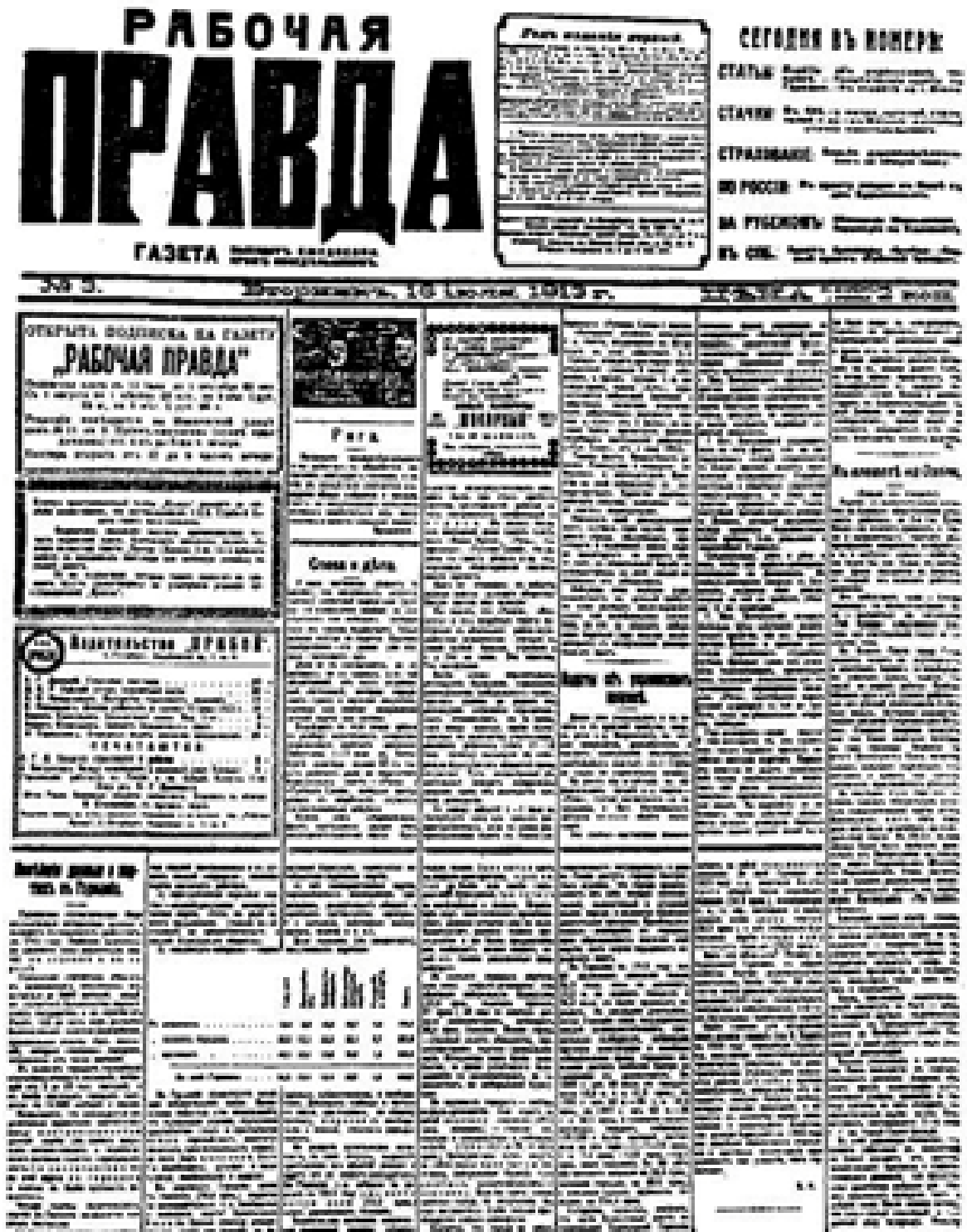
Первая страница газеты «Рабочая Правда» № 3, 16 июля 1913 г., со статьями В. И. Ленина «Слова и дела» (передовая), «Кадеты об украинском вопросе» и «Новейшие данные о партиях в Германии» Уменьшено